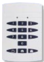
Clavier Radio 524